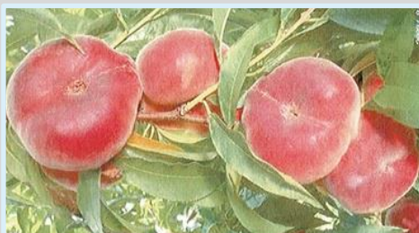
Conditionnement des fruits après récolte

Pour les personnes sans emploi et non indemnisées, une rémunération est engagée par la région Auvergne-Rhône-Alpes